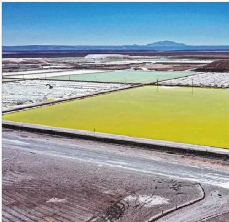
Por la mayor incertidumbre global, el precio del litio en los últimos días ha registrado bajas.

Se advierte que si estos ingresos —que pueden ser transitorios— terminan financiando gasto permanente, podrían ampliar los déficits estructurales y dificultar la convergencia de la deuda.